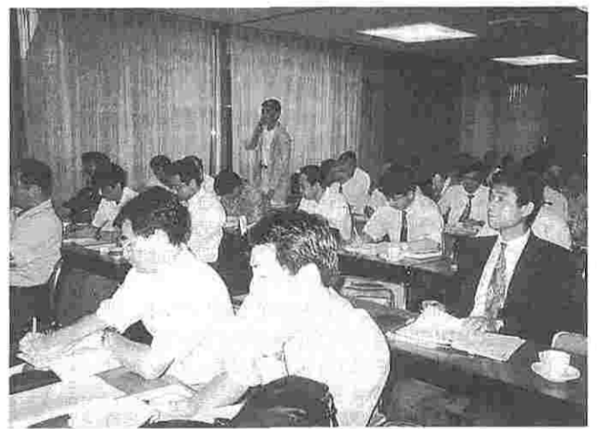
重要審議に熱心な質疑応答が展開された

に留まらず、一般職(二)表以外の職種のバランスも検討していくこと、時間外手当との絡みは血液センターの運用に習うこと、組合員資格は単組の組合規約に準すること、平成九年四月一日実施をもっと早期に実施するよう要求することなどが話し合われた。