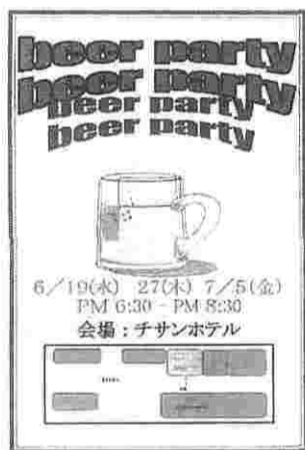
呼びかけのチラシも作成

当初はビアガーデン、焼き食へ放題、歌い放題とあって、あっといふ間の二時間呼びかけのチラシも作成