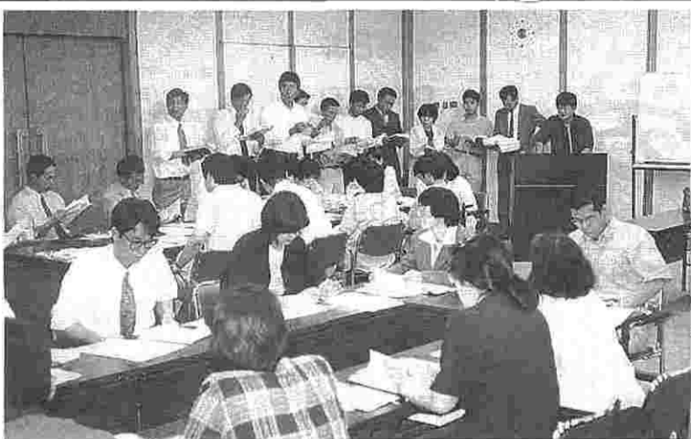
グループ内で論議した内容をまとめて発表した。

就業規則の上で勤務時間が規定されていない課長以上の職員は、労働時間が管理されていないので、労