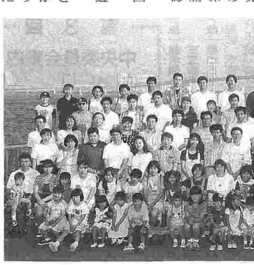
船でのんびり水際散歩、参加者全員で記念写真