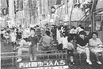
西武園ゆうえんちの家族旅行

七月九日(土)、二六四名の組合員とその家族を乗せたバス五台は、朝六時に病院を出発し、一路埼玉所沢にあるユネスコ村へと旅路を進めました。 当日の天候は、曇り時々雨という生憎の空模様でしたが、年一度の組合主催の家族参加旅行であり、各バスの中は晴々とした天気でありました。 午前十時頃、一番目の目的地ユネスコ村大恐竜館に到着。スケールの大きな展示物を、子供連の大きな歓声と驚きの声の中、カートに乗って、大変楽しく見学しました。 次に、今回の旅行の目玉でもある西武園ゆうえんちに行きま