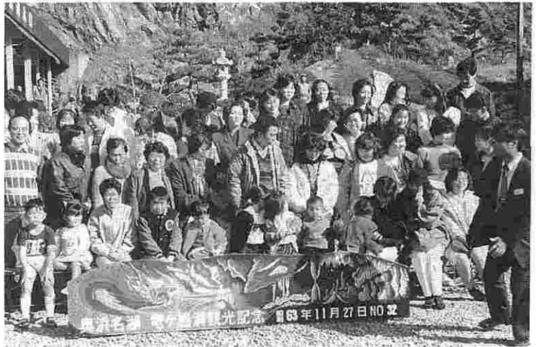
全員で、みかん狩りの記念撮影

泊旅行と、またまたこれから大さな行事も予定しており、組合員に職場以外での楽しい場を提