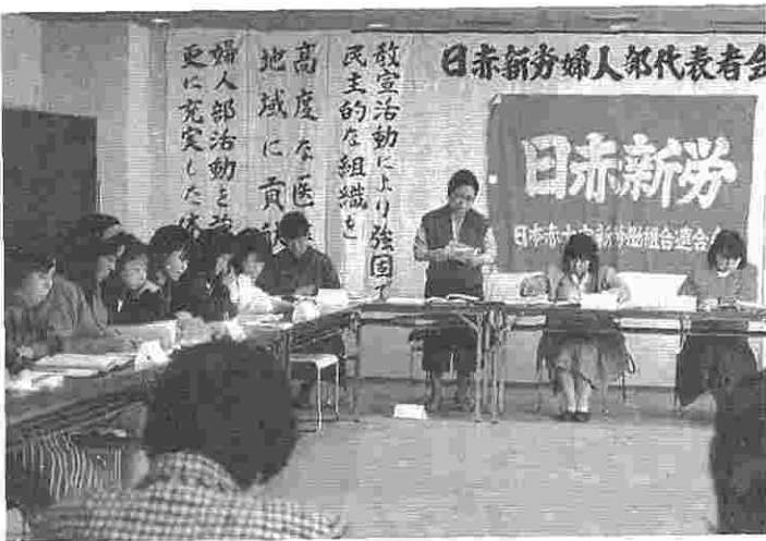
11月13～15日にかけて開かれた婦人部代表者会議

し中央執行委員長がこれを召集する」。従来、第二回中央委員会に行われていた幹部研修会は、別途に新任幹部研修会として行われることになった。