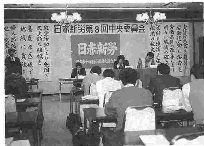
11月11～12日にかけて開かれた第3回中央委員会

一、昭和六十四年度運動方針案の婦人部労働対策について 本部より主旨説明。①均等法を生かすには、一部文章更正と誤字訂正、②看護休暇(欠勤)……③育児と仕事の……本部原案通り、活動方針の項目一、四、一項目ずつ討議。三の長期を削る……とする。なお、関連事項として提案があり、施設内保育所の有無と看護の定着状況について出席組よりの情報交換をする。