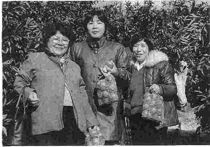
みかん狩りを満喫しました

昨年同様、今年も十一月二十七日(日)に静岡三ヶ日みかん狩りと、「果物をエサにギョウザを集めよう」と企画した日帰り旅行でしたが、舞集してみると家族連れ、往年のギャルとは、こちらの恩恵通りには……。しかし申し込み人数は五十三名と、予定していた人数があつたりホッとしました。