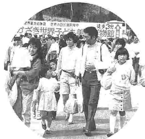
家族連れて賑わったレク

今回は、四月十九日に「岡崎 多くの人が参加してくれることと美術館」に行くこととに決定されました。当初の計画ですが、予定よりバス二台を予定して参加者 合ふやすことで予算的に少し苦の募集をしました。新入組合員 しい結果となりました。