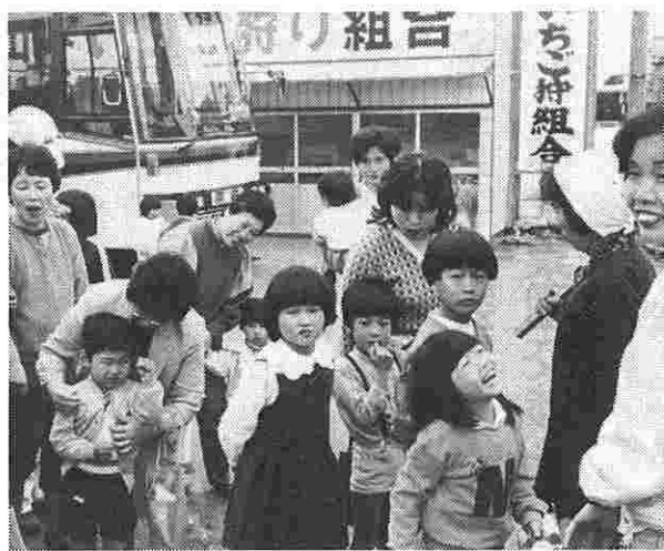
今月のオリエンテーションは家族連れでイチゴ狩り